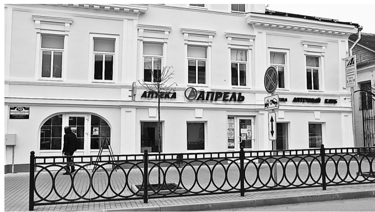
Аптека «Апрель» на ул. Коммунарной, 30